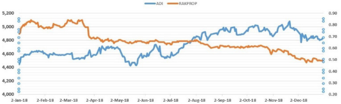
Company's Share Price Compared to the Market Index

٢- بيان مؤشر الشركة مع مؤشر القطاع الذي تنتمي إليه: